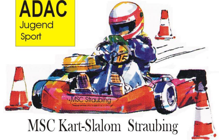
MSC Kart-Slalom Straubing